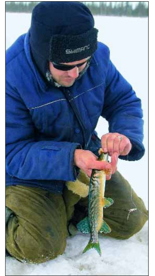
На одном из озер чешуя щурят имеет необычный лиловый оттенок.

делаешь – местный опыт, проверенный годами. Блесна у Виталия необычная для ловли из-под льда. Это мелкая летняя «вертушка» с сердечником, но с полоской сала на крючке. Запах сала и блеск вращающегося лепестка – составляющие успеха. Как впоследствии оказалось, этот тандем весьма привлекателен и для местного окуня, и для щуки.