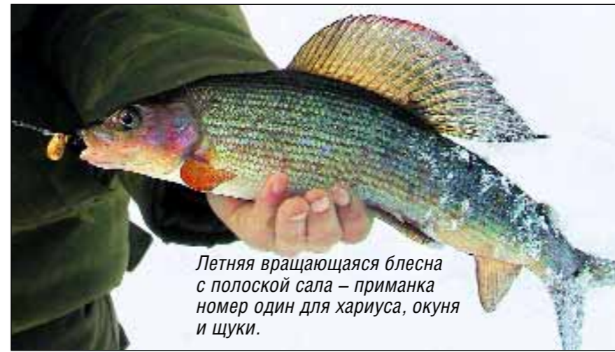
Летняя вращающаяся блесна с полоской сала – приманка номер один для хариуса, окуня и щуки.

ня чаще клевало на некрупные вольфрамовые мормышки, чем на блесны и балансиры. Но местами сильное течение уносило тяжелую мормышку слишком далеко в сторону, так что не везде удавалось нащупать дно. А более тяжелые и крупные мормышки играли грубее истораживали рыбу. Нужно было что-то придумать. Связал 20-сантиметровый поводок выше основной мормышки и привязал к нему мушку – имитацию бокоплава, к которому так неравнодушен летний хариус. Посмотрим, каковы его вкусы зимой. Сделал несколько плавных покачиваний удильником и ощутил тяжесть на леске. Сдерживая мощные толчки в руку, начинаю подмотку. Соперник уперся в лед и никак не хочет идти в лунку. Чуть отпуская и опять подматываю леску. Так повторяется несколько раз. Леска пружинит, гася рыбки сильной рыбы. Пытаюсь потянуть чуть сильнее, и рыба сходит, унося с собой «бокоплава».