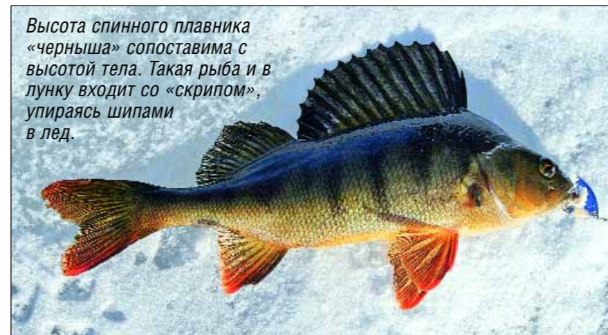
Высота спинного плавника «черныша» сопоставима с высотой тела. Такая рыба и в лунку входит со «скрипом», упираясь шипами в лед.

Мои манипуляции не проходят незамеченными, ко мне подходят компаньоны, чтобы рассмотреть приманку. Я привязываю новую мушку и делюсь «бокоплавами» с друзьями.