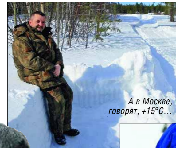
А в Москве, говорят, +15°C...

рекам здесь еще плыли льдины, озера прочно были скованы льдом. Тем удивительнее было наблюдать в мелколесье ближайшего болота одинокого серого журавля, бродящего по снегу.