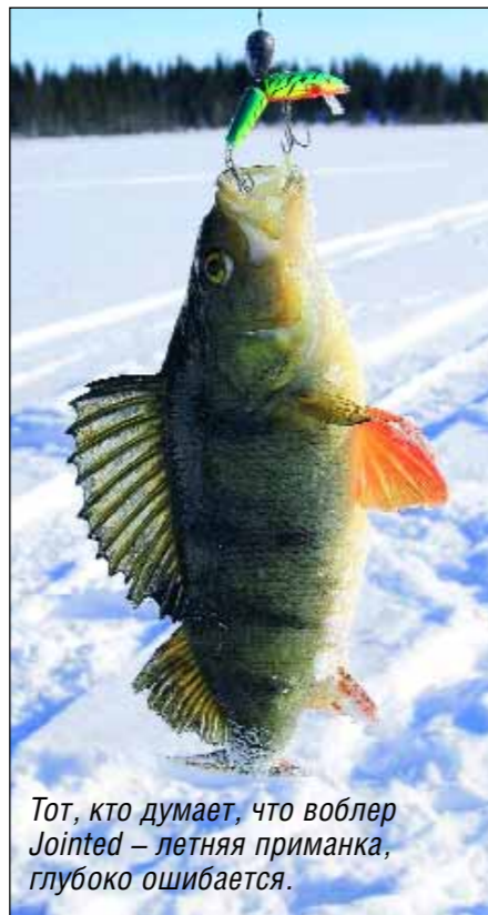
Тот, кто думает, что воблер Jointed – летняя приманка, глубоко ошибается.

И вновь бесконечная серая лента дороги наматывается на колесную ось. Зима постепенно отступает, уползая серыми полосками снега в ельники и овраги. Все ярче светит солнце. Вот уже бурлят воды разлившихся ручьев, здесь река несет последние куски льдин, а вдоль дороги распушили сережки орешник и ольха. Там и тут горят золотые почки козьей ивы, вокруг которых вьются мохнатые шмели и первые бабочки. Зимняя рыбалка завершена и вполне удачно. Хочется обязательно вновь вернуться сюда.