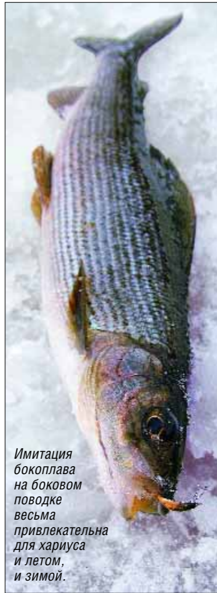
Имитация бокоплава на боковом поводке весьма привлекательна для хариуса и летом, и зимой.

Перемещаясь по реке, облавливаем места возле излучин, островов. Клев не везде стабилен. Кто-то поймал пяток трофеев, кто-то только одну рыбку, а некоторые вообще не видели поклевки. У ме-