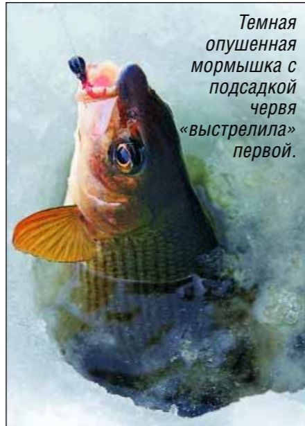
Темная опушенная мормышка с подсадкой червя «выстрелила» первой.

Песчано-гравийные береговые косы, укрытые снегом, позволяют угадать не только подводный рельеф, но и перспективные места стоянки рыбы. Важно выбрать размер и цвет удачной приманки. Темная опушенная мормышка с подсадкой червя «выстрелила» первой. Чуть позже в том же месте произошла вторая поклевка. Отлично, стайка обнару-